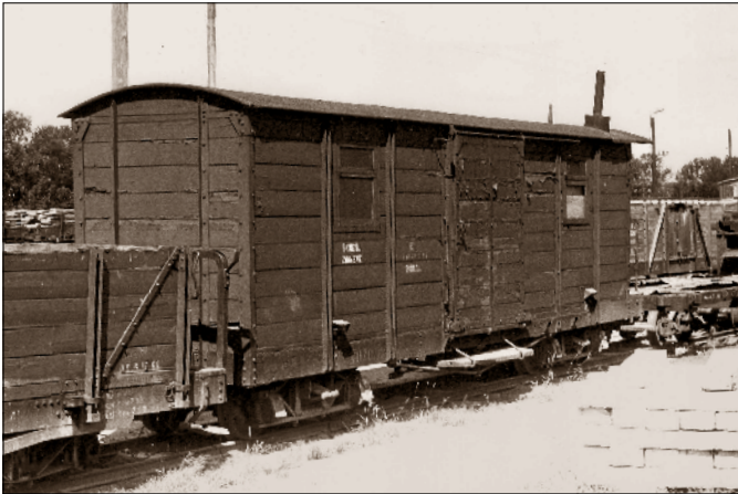
„Towos” przebudowany w Rogowie na wagon bagażowy Fxh 4076 oczekuje fizycznej kasacji w Ciechanowie, 1968 r.

na Fxh (wagon bagażowy), jednak pozostawiono dotychczasowe numery inwentarzowe,