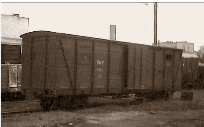
Jedynе znane zdjęcie jednego z dwóch „towosów” bez hamulca, tj. saksońskich wagonów krytych. Tutaj w Sochaczewie, po dokonanej w Rogowie przebudowie na wagon bagażowy Fxh 4087, 29.05.1972 r.

W 1987 r. skasowano jeden z wagonów bagażowych (Fhx 4183). Rok później przysłano z Piotrkowa dwa 4-osiowe wagony bagażowe, które – podobnie jak poprzednie – powstały w ramach przebudowy z wagonów krytych produkcji Zakładów Ostrowieckich z 1930 r. W ich przypadku przebudowy dokonano w 1961 r. w warsztatach Kolei Piotrkowskiej. Od tego czasu w Rogowie znajdowały się łącznie 4 wagony bagażowe.